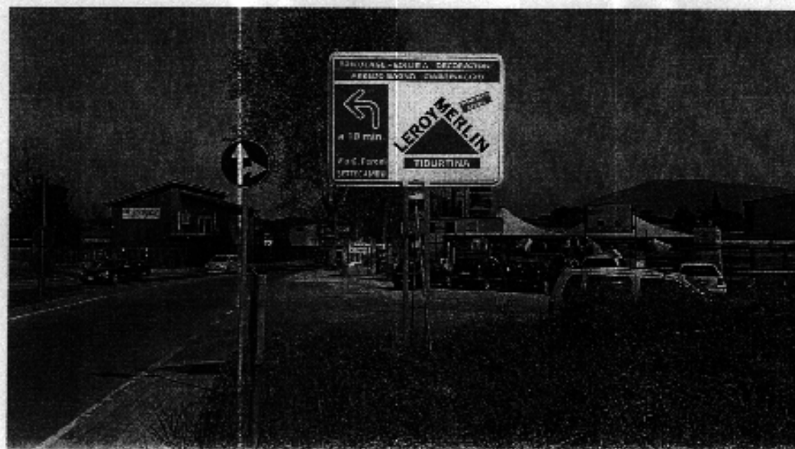
FOTO IMPIANTO PUBBLICITARIO

Sono state scattate fotografie sull'impianto: Sì No